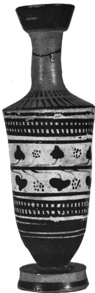
Fig. 2. — Lécythe attique. Env. 470 av. J.-C. Musée d'archéologie et d'histoire de Lausanne. Catalogue de l'exposition Lausanne 1976, N° 32.