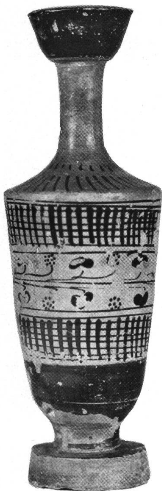
Fig. 3. — Lécythe corinthien. Env. 470 - 460 av. J.-C. Musée d'archéologie et d'histoire de Lausanne. Catalogue de l'exposition Lausanne 1976, N° 33.