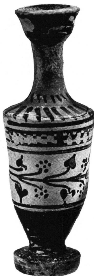
Fig. 4. — Lécythe eubéen. Provenance Erétrie. Second quart du Ve siècle av. J.-C. Inédit.