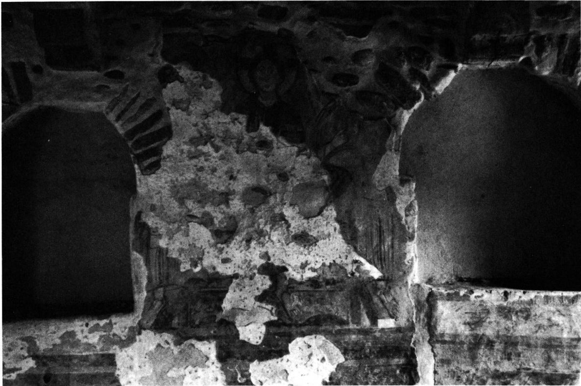
Fig. 6. — TORBA: tour, 2 e étage, mur est: Christ au trône (avec deux anges); à droite sous la fenêtre deux canards (de part et d'autre d'une hydrie).