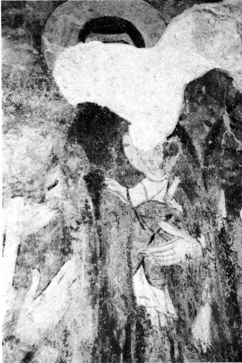
Fig. 3. — TORBA: idem, après la restauration et la disparition de la tête.