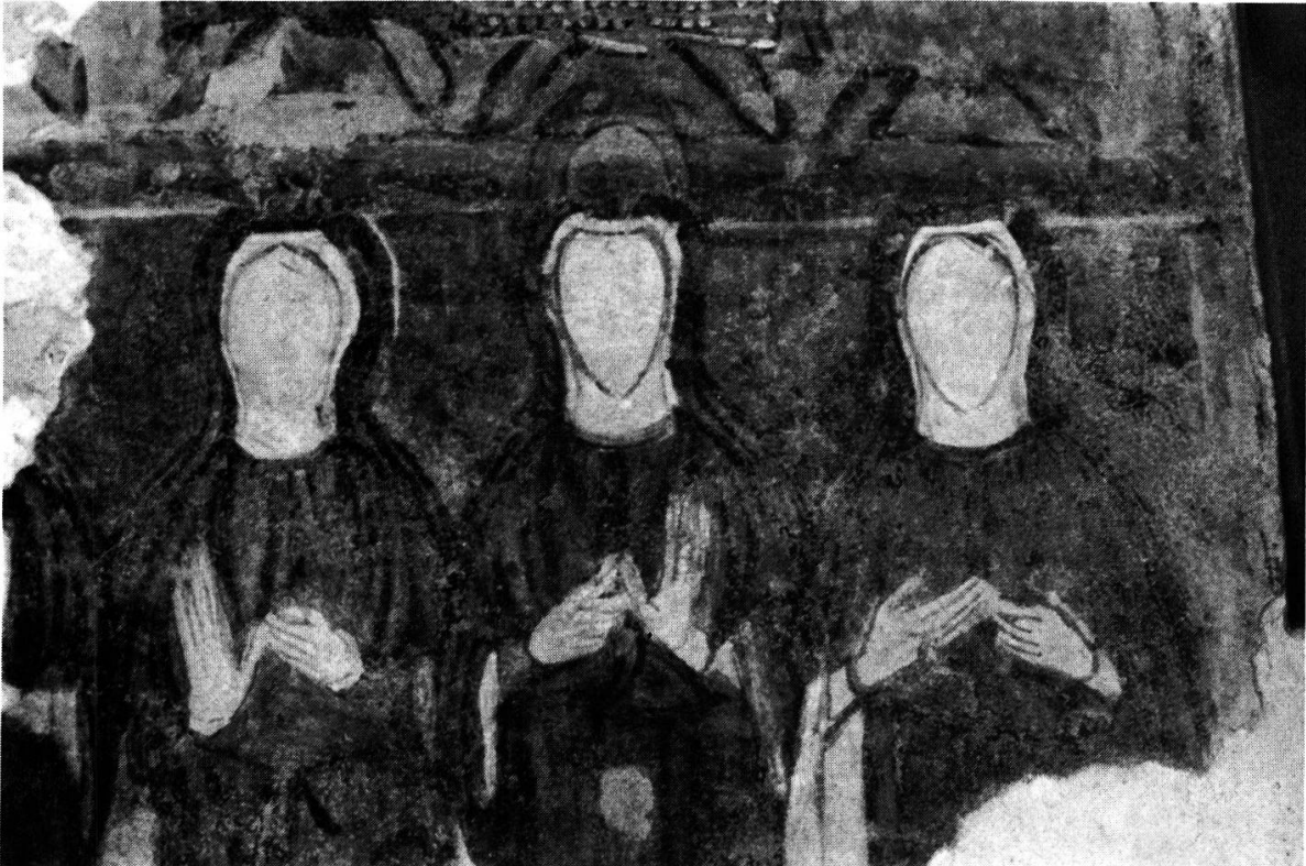
Fig. 5. — TORBA: idem; les nonnes .