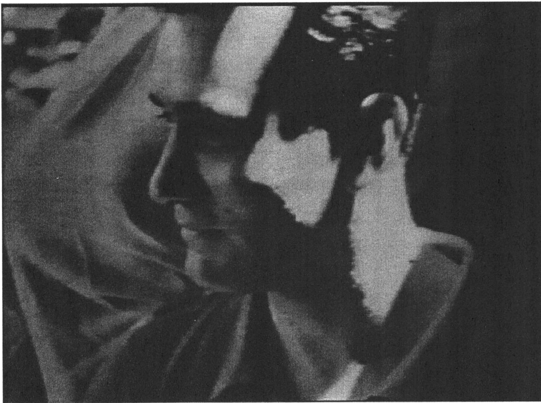
Abb. 5. Architects' Congress (1933).