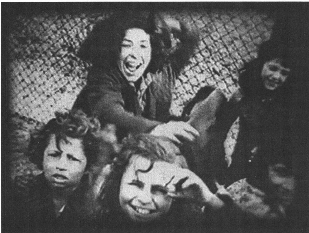
Abb. 3. Grossstadtzeuner (1932-1933).