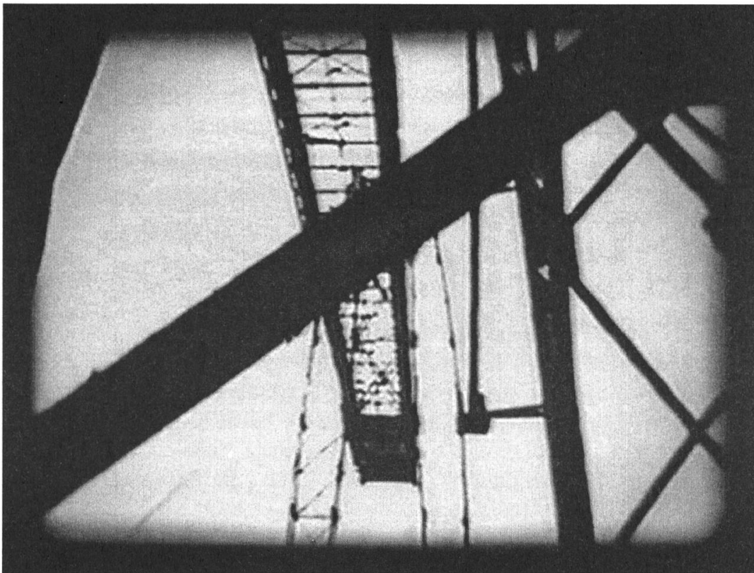
Abb. 1. Impressionen vom alten Marseiller Hafen (1929).