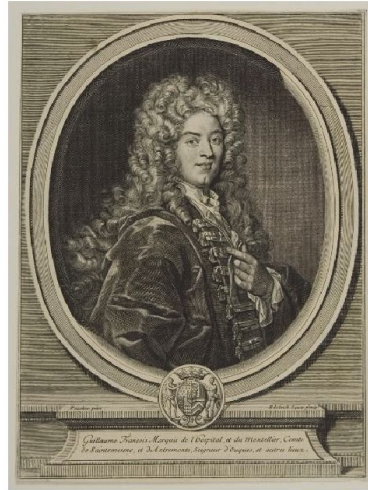
Abbildung 1 Zeitgenössisches Bild von l'Hôpital

und g in einem Intervall um a und der Existenz von \lim_{x \rightarrow a} \frac{f'(x)}{g'(x)} , dass auch \lim_{x \rightarrow a} \frac{f(x)}{g(x)} existiert und die beiden Grenzwerte übereinstimmen. Diese Aussage wird als Regel von l'Hôpital bezeichnet, weil – wie es in vielen Büchern zur Geschichte der Mathematik heißt 1 – diese Regel sich in dem ersten gedruckten Lehrbuch zur Differential- und Integralrechnung findet, der 1696 erschienenen Analyse des infiniment petits von G.F.A. de l'Hôpital. 2