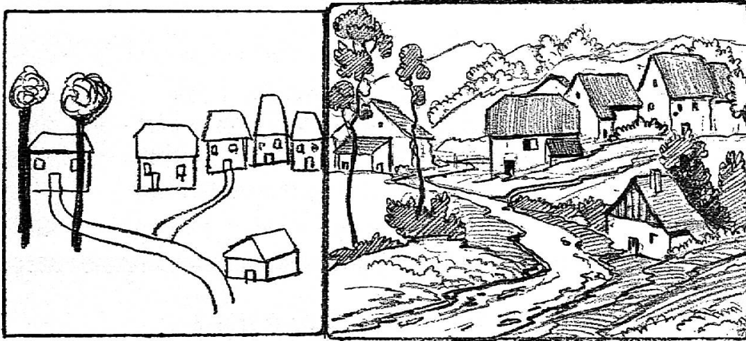
Fig. 267. — Dessin d'élève.