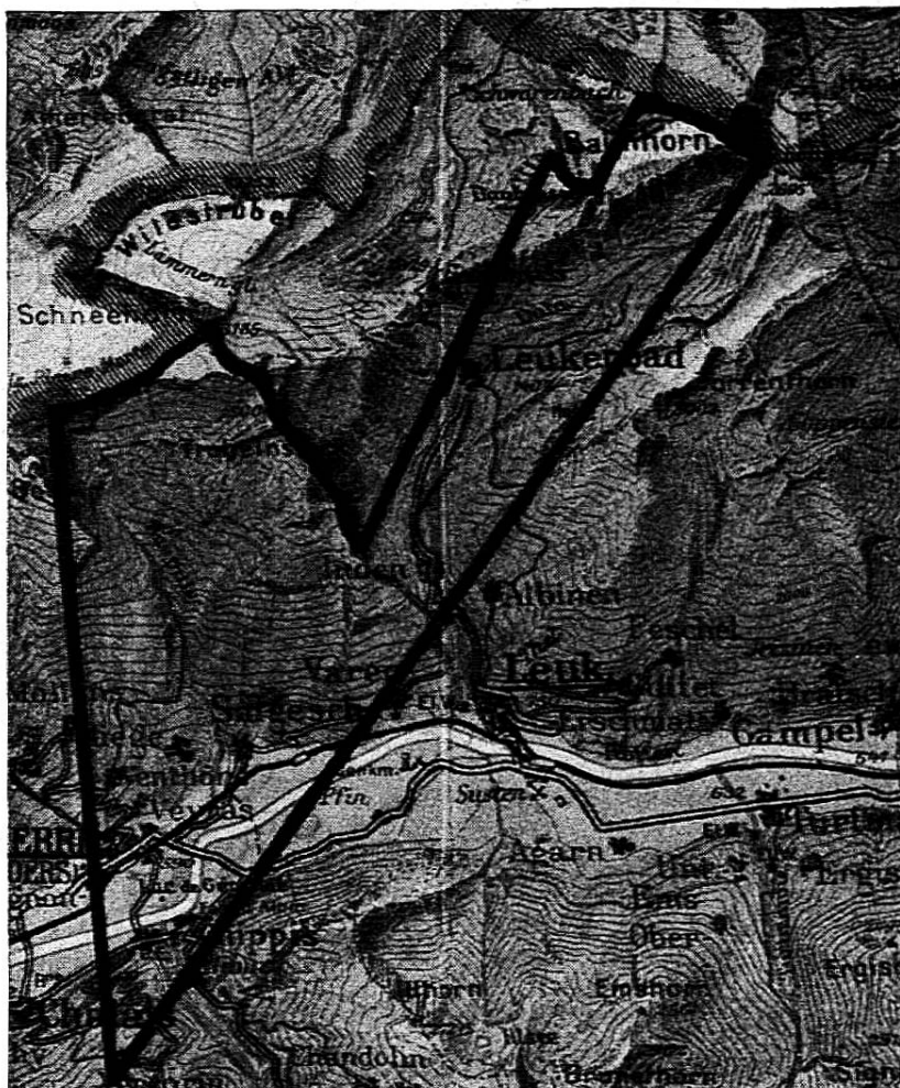
FIG. 1. — Délimitation du tableau sur la carte.

Le débouché du val d'Anniviers, visible à droite au premier plan, montre les nombreux lacets par lesquels la route gagne la différence d'altitude.