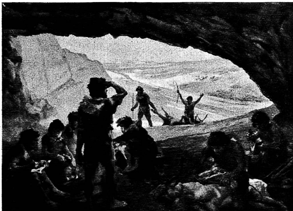
Les hommes des cavernes.

Groupe : Histoire générale (Epoque préhistorique). Peintre : ERNEST HODEL, Lucerne. Bourgeois de Unterlangenegg (Berne) et Lucerne, né en 1881.