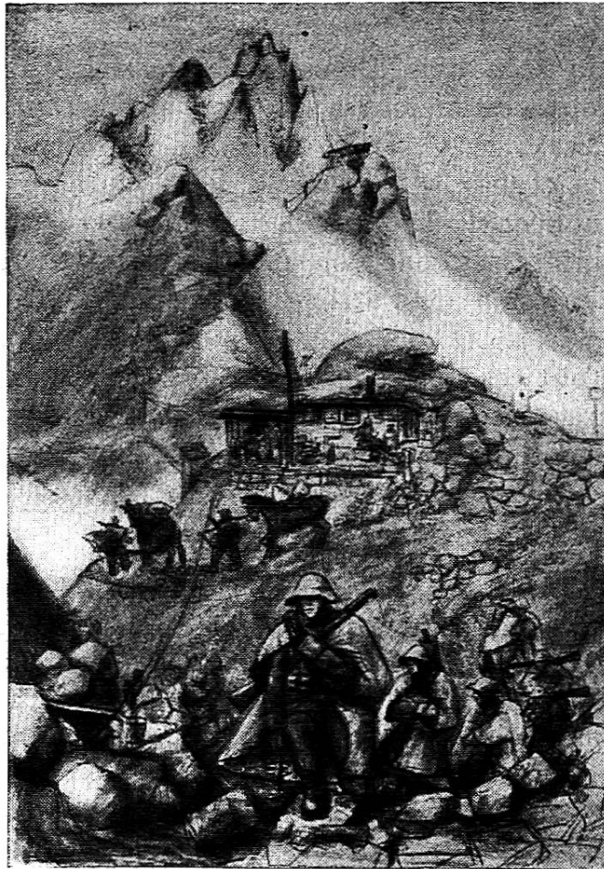
La garde de nos frontières : Mitrailleurs de montagne.

Bourgeois de Stein (Saint-Gall) ; né en 1909.