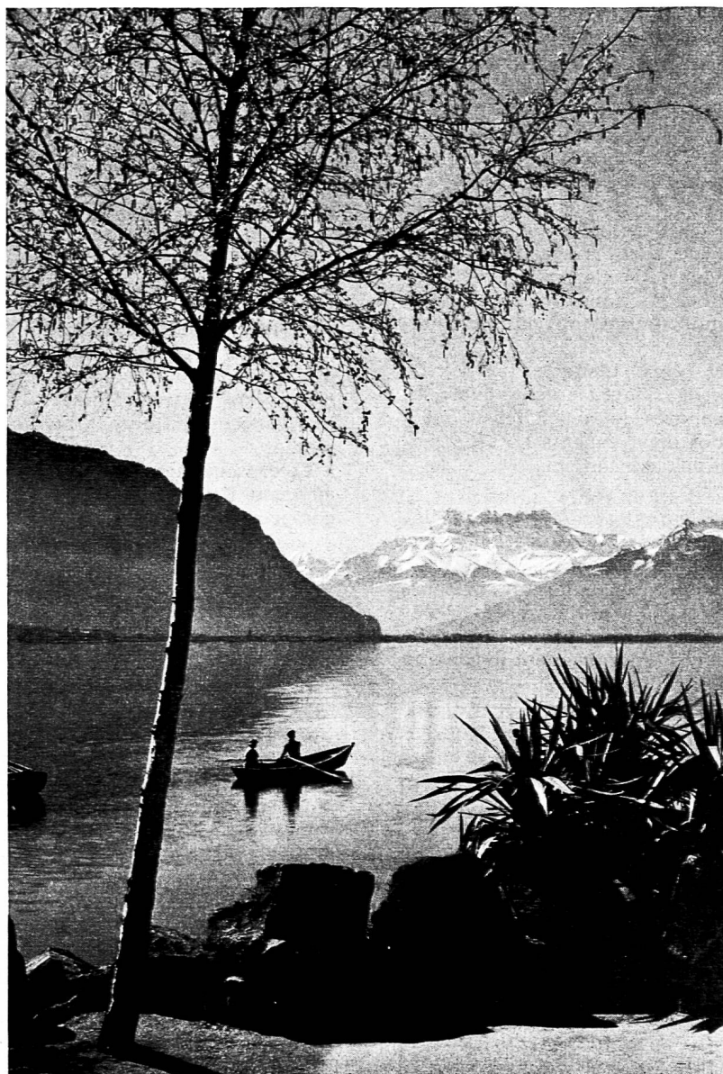
Quai de Montreux-Territet