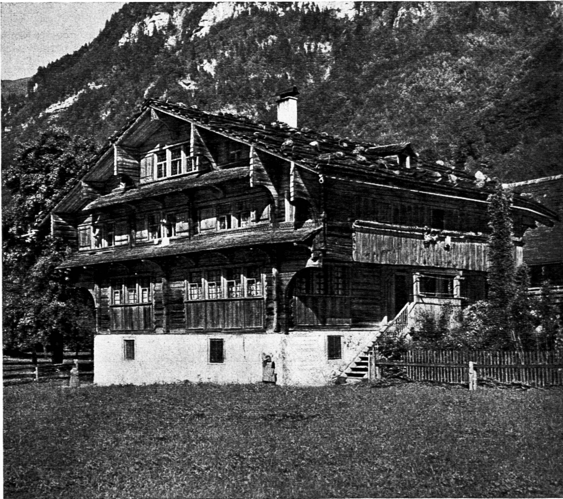
Maison unterwaldienne à Stans

Rédacteurs responsables: Educateur, André CHABLOZ, Lausanne, Clochetons 9; Bulletin, G. WILLEMIN, Case postale 3, Genève-Cornavin. Administration, abonnements et annonces: IMPRIMERIE CORBAZ S.A., Montreux, place du Marché 7, téléphone 6 27 98. Chèques postaux II b 379 PRIX DE L'ABONNEMENT ANNUEL: SUISSE FR. 15.50; ÉTRANGER FR. 20.- • SUPPLÉMENT TRIMESTRIEL: BULLETIN BIBLIOGRAPHIQUE