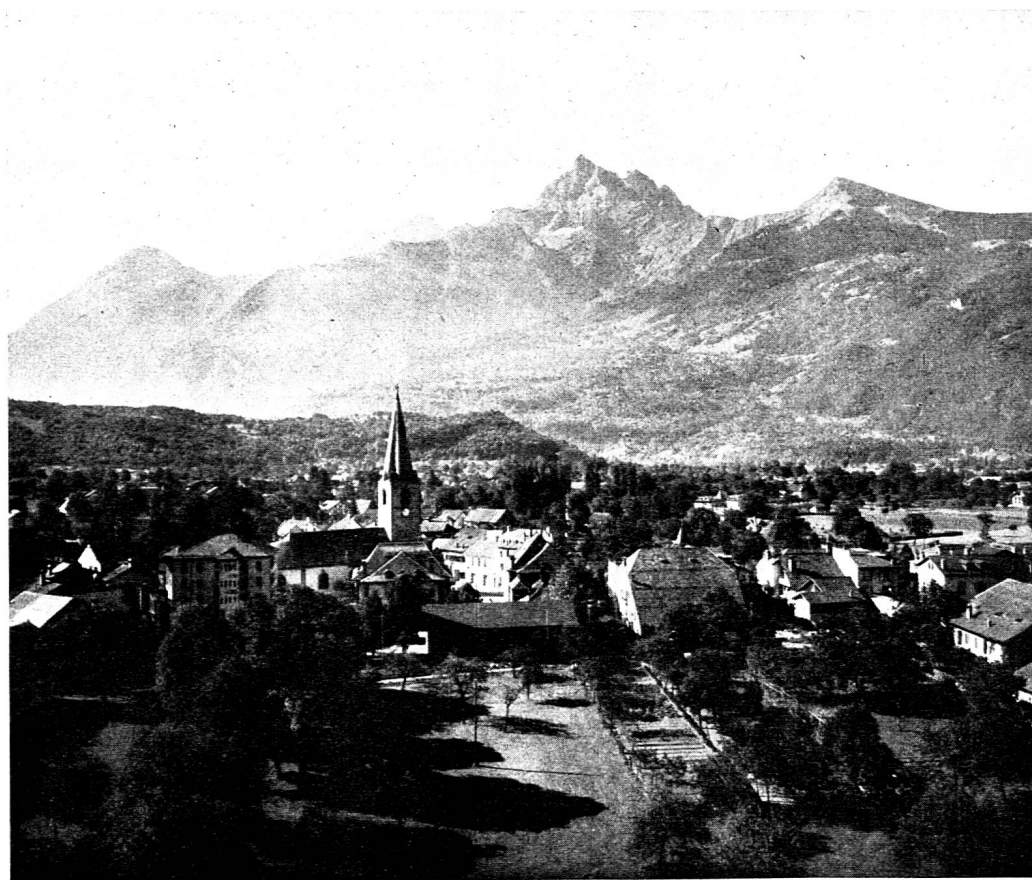
Bex, au pied des Alpes vaudoises

Rédacteurs responsables: Educateur, André CHABLOZ, Lausanne, Clochetons 9; Bulletin, G. WILLEMIN, Case postale 3, Genève-Cornavin. Administration, abonnements et annonces: IMPRIMERIE CORBAZ S. A., Montreux, place du Marché 7, téléphone 6 27 98. Chèques postaux II b 379 PRIX DE L'ABONNEMENT ANNUEL: SUISSE FR. 20.-; ÉTRANGER FR. 24.- • SUPPLÉMENT TRIMESTRIEL: BULLETIN BIBLIOGRAPHIQUE