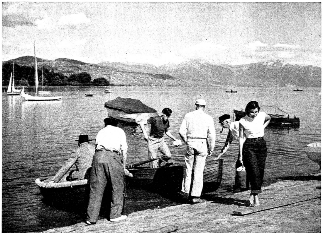
Sur les bords du Léman