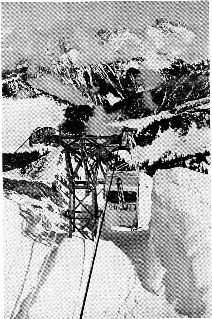
Inauguré l'hiver dernier, le télécabine Les Mosses-Lac Lioson-Pic Chaussy est l'une des installations les plus audacieuses de Suisse romande.

Rédacteurs responsables: Educateur, J.-P. ROCHAT, Direction des écoles primaires, Montreux, Bulletin, G. WILLEMIN, Case postale 3, Genève-Cornavin. Administration, abonnements et annonces: IMPRIMERIE CORBAZ S.A., Montreux, place du Marché 7, téléphone 62 47 62 Chèques postaux II b 379 PRIX DE L'ABONNEMENT ANNUEL: SUISSE FR. 20.- ; ÉTRANGER FR. 24.- • SUPPLÉMENT TRIMESTRIEL: BULLETIN BIBLIOGRAPHIQUE