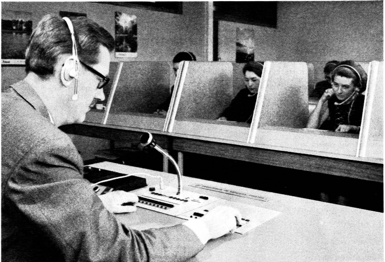
Démonstrations à Genève : Tutor S.A. Mobilier : Embru-Werke, Rüti ZH