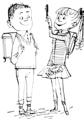
En vente dans les bonnes papeteries