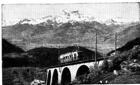
Aigle-Leysin en 30 min.

tous les livres neufs et d'occasion et tous les livres d'école