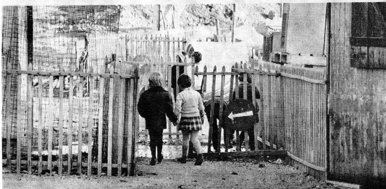
Le chemin des écoliers