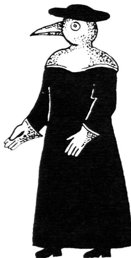
Costume du médecin: le bec du masque était rempli de substances aromatiques destinées à purifier l'air.

Ces marrons seront longtemps les professionnels de la peste. Malgré leur dévouement pour les malades et les morts, malgré les risques qu'ils courent, ils encaisseront souvent plus de critiques que d'éloges ou de florins. Fabri ne leur accorde que deux qualités: saleté et ignorance. Ils ont plus ou moins droit aux dépouilles des décédés, lorsqu'on ne les brûle pas; ils ne se gênent pas de se servir à l'avance, dit-on. En 1542, s'ébauche un service médical, à Lausanne et Vevey, par la désignation d'un chirurgien des pestiférés — c'est un barbier, les deux termes sont alors synonymes — puis d'un médecin. Mais, tandis que le médecin n'entre pas en contact avec ses malades, formulant à distance diagnostic et ordonnances, le chirurgien portera en fait tout le poids des soins aux pestiférés. C'est lui qui fait les saignées, ouvre les bubons, panse les charbons; seul le marron est en contact aussi intime avec les patients.