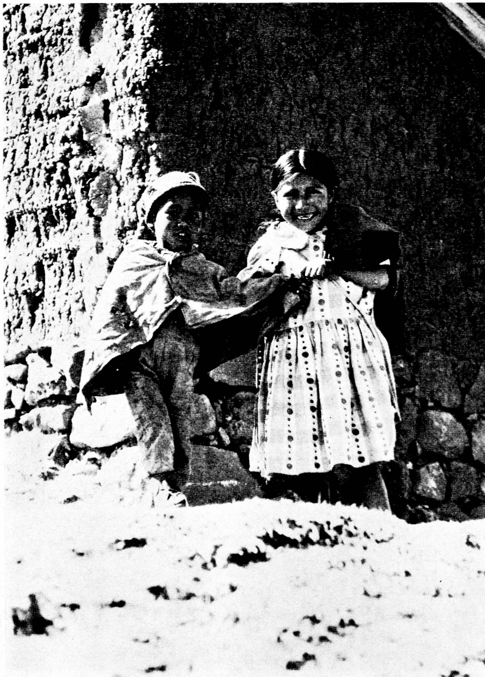
Pérou : sur les Hauts-Plateaux