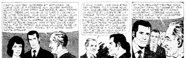
Fig. 3 : Graton « Des filles et des moteurs » Dargaud Ed.