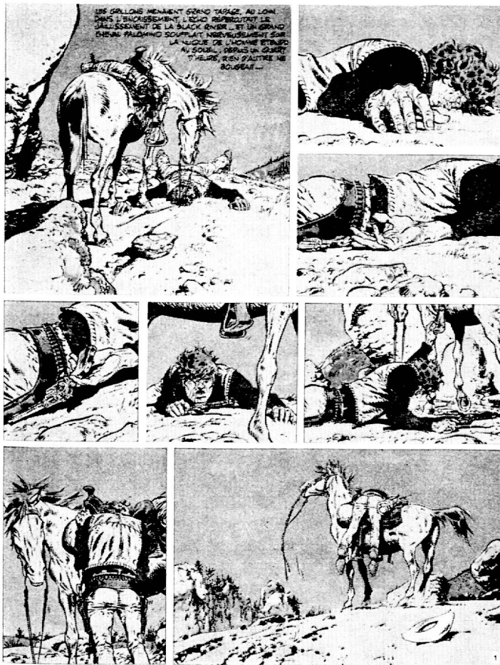
Fig. 1 : Hermann-Greg « Le ciel est rouge sur Laramie » Dargaud Ed.