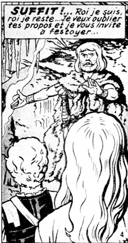
Fig. 4 : Martin « Iorix le Grand » Castermann Ed.

nière devient ambiguë pour la raison que les gestes et les attitudes peuvent être interprétés de plusieurs façons. Parmi plusieurs « possibles », la parole détermine un seul « certain ».