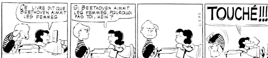
Fig. 6 : Schulz « Peanuts » UPI Ed.

Un discours trop long peut être parfois intégré de manière plus astucieuse sous la forme, par exemple, de coupures de journaux.