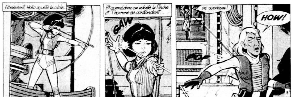
Fig. 5 : Leloup « La forge de Vulcain » Dupuis Ed.

3 e image : le résultat ; l'homme est touché. C'est l'effet. Le trajet de la flèche est supposé, localisé entre les deux images.