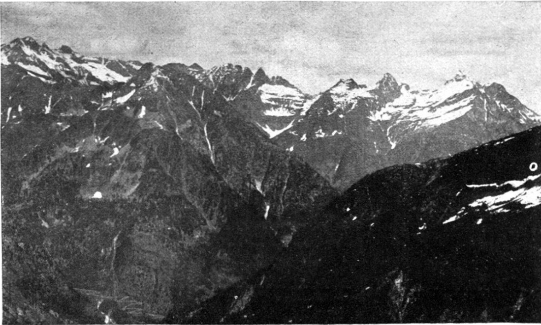
FIG. 1. — Quermulde der Tessinerdecken.