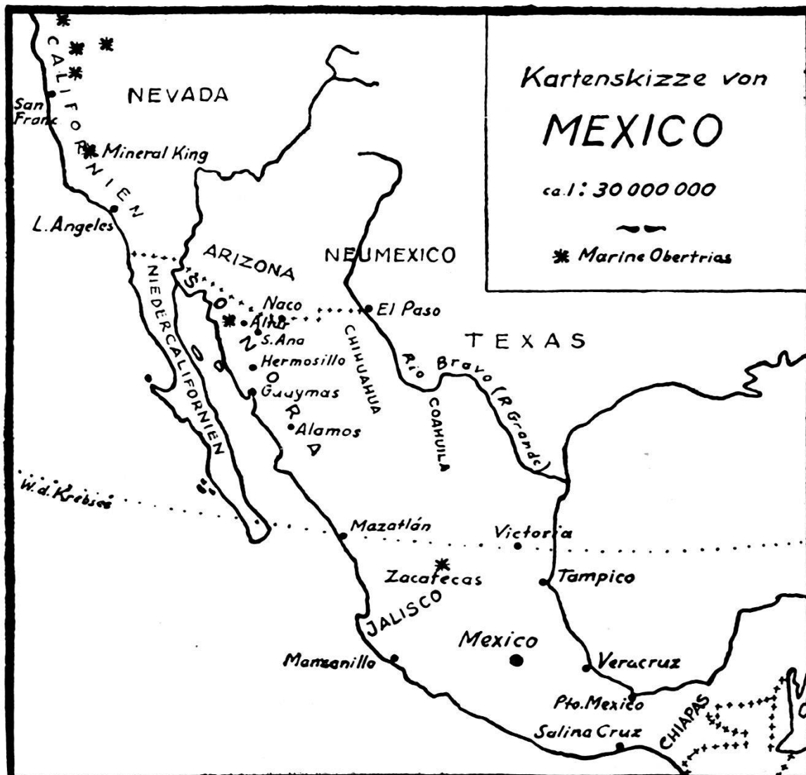
Figur 1. Kartenskizze von Mexico.

Die zacatekische Trias wird von BURCKHARDT der julischen Unterstufe des Carnien zugewiesen; SMITH (26) nimmt sie als Äquivalent seiner Trachycerasunterabteilung (s. o.), was beides einander ziemlich entsprechen dürfte. Demnach wären in Mexiko zwei Facies