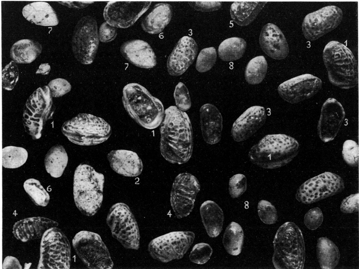
Fig. 3. Marine Ostrakodenfauna von BD 195.

Salinitätsschwankungen tragen. – Wir glauben, dass hier die Thanatocönosen tatsächlich die biologische Faunenzusammensetzung widerspiegeln. Denn unsere Faunen haben alle einen ziemlich reinen Aufbau: im oligo-miohalinen Bereich zum Beispiel fehlen marine Ostrakoden-Arten (mit Ausnahme einer einzelnen allochthonen Progonocythere blakeana ) wie auch Foraminiferen vollständig; umgekehrt zeigten sich im marinen Milieu nirgends Cyprideis ?-Formen, einzig fanden sich in zwei Proben ganz vereinzelt Oogonien. Im Falle massiver Zusammen-