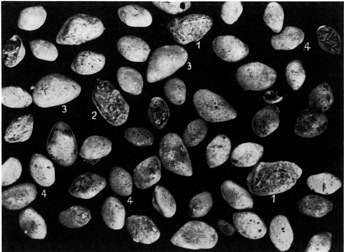
Fig. 2. Brachyhaline Ostrakodenfauna von BD 210. (1 = Progonocythere cf. juglandica , 2 = Lophocythere scabra , 3 = n. g. B , sp. 103, 4 = Eocytheropteron sp. 21). Vergrößerung zirka 25fach.

BD 210 schreiben wir einem brachyhalinen Milieu zu. Es zeigen sich darin bereits Vertreter der Gattungen Oligocythereis , Lophocythere (beide selten) und – zahlreicher – Progonocythere . In grösserer Zahl treten aber auch Eocytheropteron sp. 21 und n. g. B , sp. 103 auf, Arten, die wohl euryhalin sind, sich aber nach unsern Beobachtungen in einem normal marinen Milieu nicht voll entfaltet.