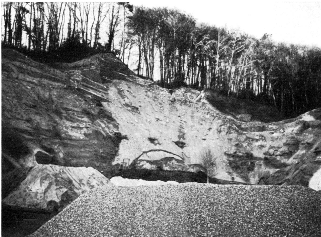
Fig. 35. Cône de déjections fluvio-glaciaire. Retrait würmien. Lucens, route de Cremin.

De part et d'autre du débouché du vallon de la Cerjaule, le versant de la vallée de la Broye est tapissé d'une couche de sables et de graviers stratifiés. Au NE de