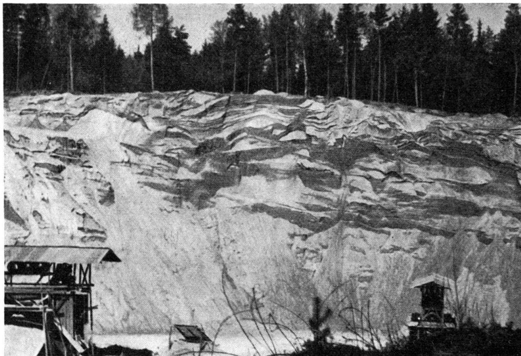
Fig. 37. Sables et graviers fluvio-glaciaires stratifiés du retrait würmien. Gravière de Ménières.

Cette terrasse est séparée de la plaine de la Broye par le talus de Sous le Mont, d'une hauteur de 40 m.