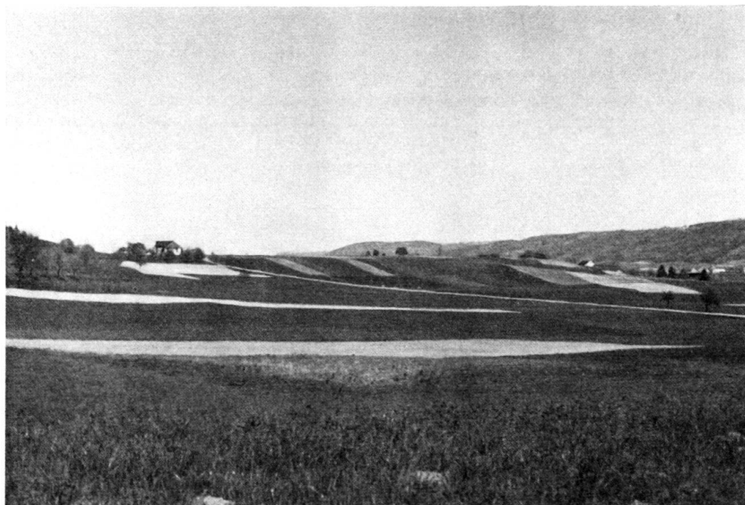
Fig. 38. Le delta fossile de la Lembe. Postwürm ancien. Granges.

En coupe axiale, on reconnaît (fig. 38) :