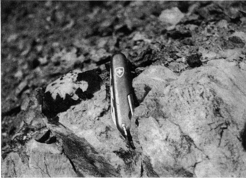
Fig. 1. Inclusion étudiée avec bord foncé.

La partie centrale de l'inclusion est une roche blanche, finement grenue, d'allure homogène. Sous le microscope, le trait le plus frappant est sa structure de diabase; un minéral en plages allongées forme une trame intersertale, divergente par places, les plages du minéral en question rayonnant à partir de centres. Entre nicols croisés, ces plages restent obscures, toutefois, un examen avec un fort grossissement relève, çà et là, des taches faiblement biréfringentes formées de grains minuscules probablement fibroradiés.