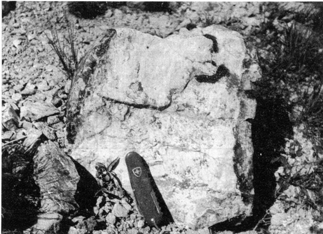
Fig. 3. Inclusion rodingitique de l'Alpe Champatsch en forme de dike.

La zone intermédiaire n'est qu'un mince liseré de 1 à 2 mm de large, composé essentiellement de chlorite avec une poussière de granules beiges et quelques grains franchement opaques. On note encore quelques «fantômes» de sections prismatiques rappelant celles de la partie interne.