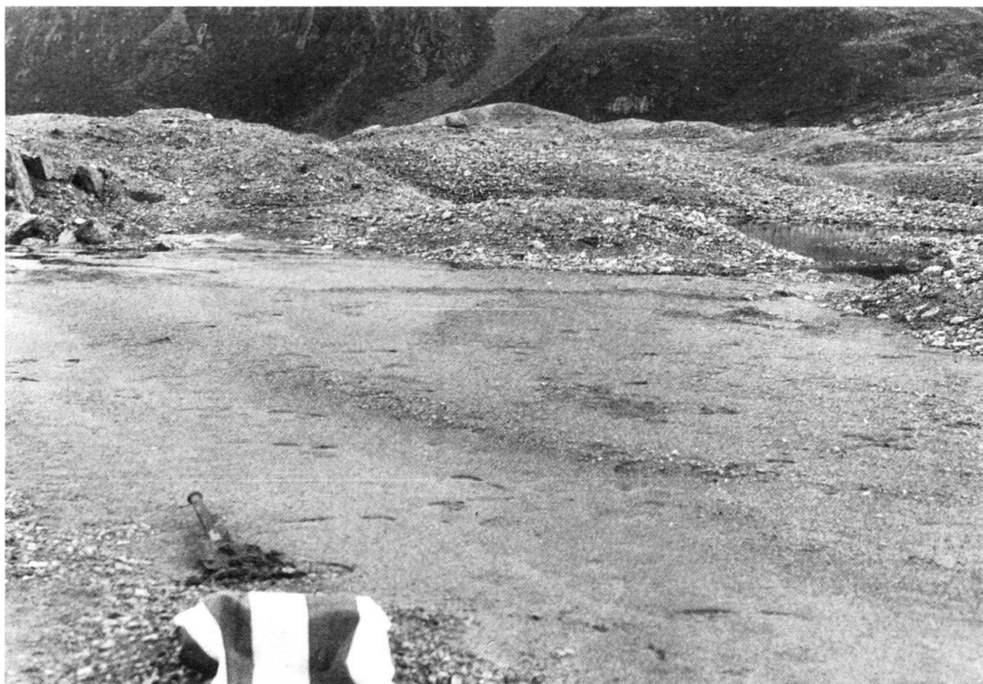
Fig. 1. Eisrandschwemmkegellandschaft im Vorland des Porschabellagletschers (Graubünden).