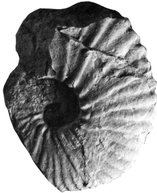
Fig. 3. Mantelliceras saxbii SHARPE, J21931, von ca. 2 m südöstlich unterhalb der kleinen Brücke über dem Ravin Le Mortruz in etwa der gleichen Schicht wie der Pachydesmoceras aff. denisonianum (STOLICZKA). Vergl. KENNEDY & HANCOCK, 1971, Taf. 79, Fig. 1.

Ebenfalls aus diesen Schichten stammt der hier beschriebene Pachydesmoceras cf. denisonianum (STOLICZKA), dessen genauer Fundort auf dem Profil in Fig. 2 eingetragen wurde.