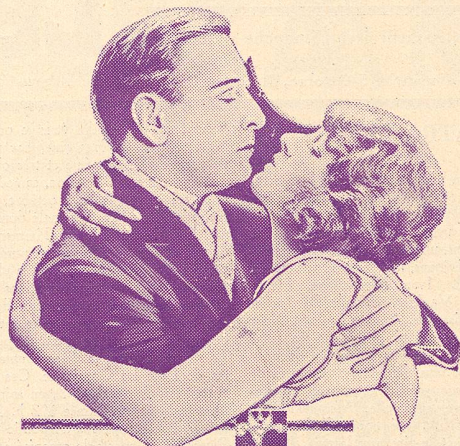
Corinne Griffith and Conway Tearle in "Lilies of the Field"

LA MEILLEURE PELLICULE NÉGATIVE ASTRA POSTIVE LA MOINS CHÈRE M. SAUTY & C e , GENÈVE 58, Rue de Carouge, 58