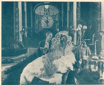
Jaque Catelain et Huguette Duflos

Pourtant ces éléments risquaient de demeurer désunis, sans l'intervention de Douglas Fairbanks, acteur unique, souple comme un fauve, jeune comme Adonis et susceptible d'employer