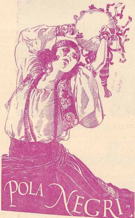
dans LA DANSEUSE ESPAGNOLE interprète le principal rôle de Maritana une Tzigane qui passe intrépide à travers tous les dangers pour sauver son bien-aimé.

qui interprète le rôle de LA DANSEUSE ESPAGNOLE