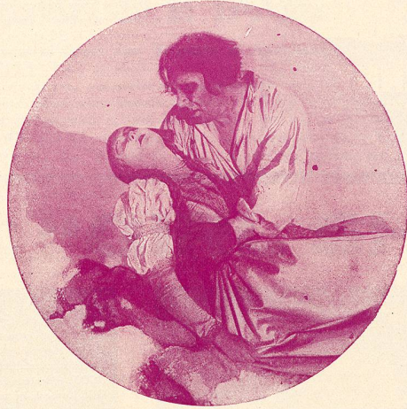
Il prend la jeune fille dans ses bras et déjà ses lèvres s'avancent vers les lèvres exangues de l'enfant, mais il sursaute, ce n'est qu'un cadavre qu'il serre dans ses bras.

Alors, il veut jeter le corps par-dessus le traîneau, mais les jambes du cadavre sont prises dans le marchepied et le corps inanimé de la malheureuse fille est traîné dans la neige à une allure folle.