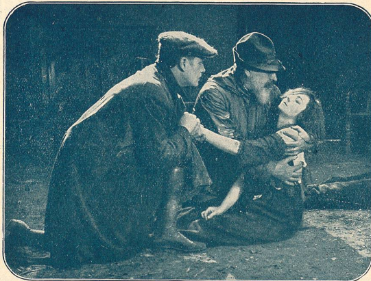
Le chatelain et Aubert le piqueur, qui aimait secrètement Marielle, surviennent et la trouvent presque privée de raison, hébété devant le cadavre du misérable qu'elle aimait.