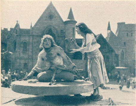
QUASIMODO (Lon Chaney)