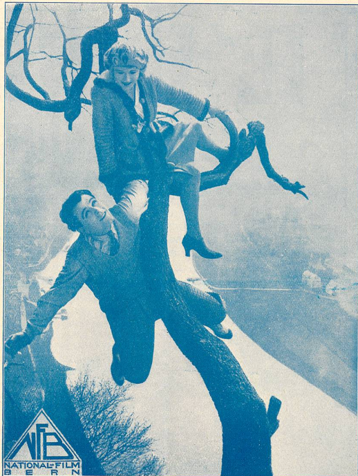
Une scène du film MISTER RADIO