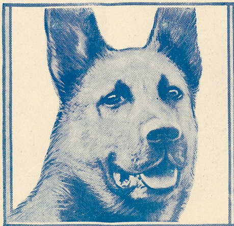
Strongheart in The Love Master