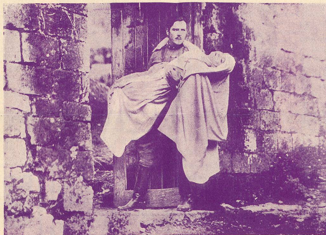
Une scène de Sœur Blanche.