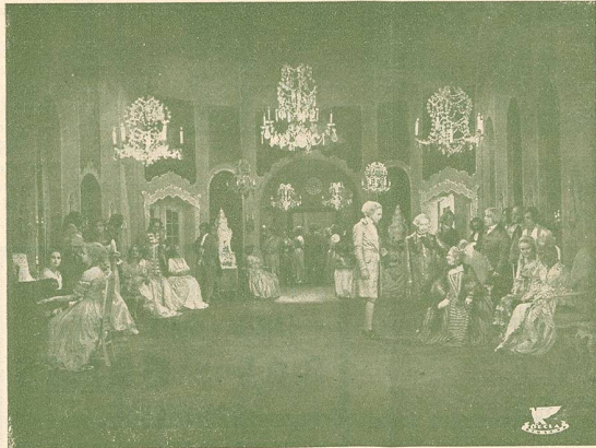
Une Scène de Cendrillon

Mme Bricoli, qui voudrait marier une de ses