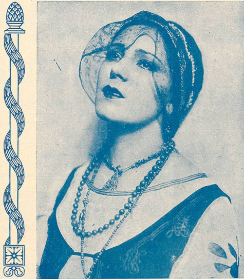
Raquel Meller dans La Terre Promise.

d'Henry ROUSSEL avec RAQUEL MELLER au Cinéma du Bourg.