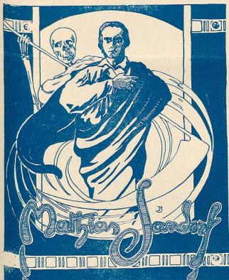
Mathias Sandorf au Royal

Je ne sais rien de plus exécrable que ces imitateurs. Si vous êtes incapable de rien produire par vous-même, n'essayez pas de briller des rayons de gloire volés à d'autres, en essayant d'imiter l'imitable Charlie, vous n'êtes plus comique, vous êtes ridicule.