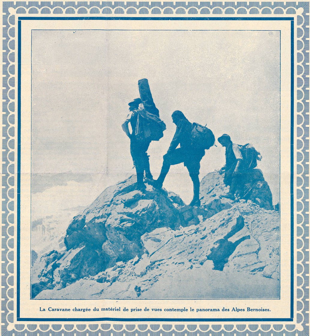
La Caravane chargée du matériel de prise de vues contemple le panorama des Alpes Bernoises.

soixante mètres, c'est alors que je constate avec stupeur que les deux châssis qui me restent n'ont pas de film pour « amorcer »! Que faire? Ici point de chambre noire! Nous ne pouvions pourtant pas interrompre notre travail, perdre une journée pour une bêtise pareille!