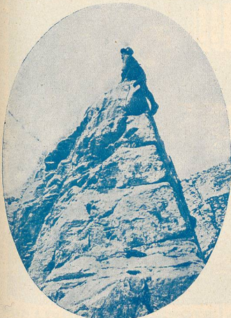
Le guide Veillon atteint l'arête

Troisième journée; le soleil se lève au moment où nous arrivons sur l'arête; il y a deux heures que nous sommes en route; nous retrouvons intact notre matériel où nous l'avons laissé; le temps est toujours magnifique, décidément nous avons de la chance! Nous avons repris l'escalade; les passages difficiles se succèdent à notre grande joie; mais voici qu'arrivé au bout de mes premiers