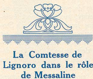
La Comtesse de Lignoro dans le rôle de Messaline

Les réalisateurs italiens peuvent seuls nous donner l'illusion de pareilles survivances qui ont toute la vraisemblance de la vérité. Ajoutez à ces cons-