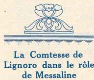
La Comtesse de Lignoro dans le rôle de Messaline

Les réalisateurs italiens peuvent seuls nous donner l'illusion de pareilles survivances qui ont toute la vraisemblance de la vérité. Ajoutez à ces cons-