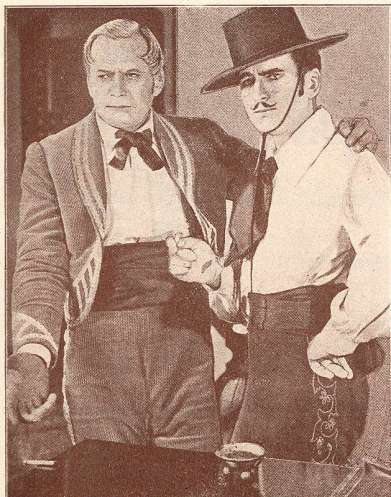
DOUGLAS FAIRBANKS dans Don X Zorro père . Production United Artists.