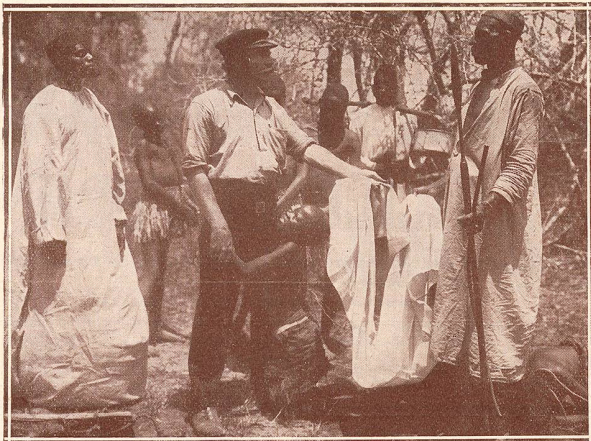
LIVINGSTONE le grand explorateur africain. Sa vie et son œuvre.

Mary Astor, dans le rôle de Dolores, a toute la grâce d'une innocente jeune fille de noble famille et sa beauté ne fait que parachever la valeur artistique de cette production. Ce film est fait pour charmer ; c'est l'amour jeune dans toute sa beauté, la splendeur des châteaux somptueux, les intrigues des cours royales et, par-dessus tout, le claquement d'un fouet vengeur mêlé au choc des épées scintillantes.