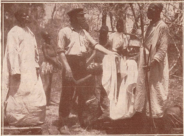
LIVINGSTONE le grand explorateur africain. Sa vie et son œuvre.

Mary Astor, dans le rôle de Dolores, a toute la grâce d'une innocente jeune fille de noble famille et sa beauté ne fait que parachever la valeur artistique de cette production. Ce film est fait pour charmer ; c'est l'amour jeune dans toute sa beauté, la splendeur des châteaux somptueux, les intrigues des cours royales et, par-dessus tout, le claquement d'un fouet vengeur mêlé au choc des épées scintillantes.