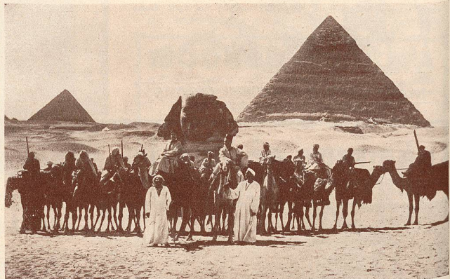
Une scène du Raid en Avion autour du Monde.

Partis de Paris, ils se sont dirigés par Marseille vers l'Égypte, ont traversé la Mer Rouge et l'Océan Indien, touchant aux régions les plus intéressantes des Indes, se transportant ensuite