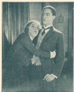
Alfred LUNT et Jobyna HOWLAND Une scène du film Dix Femmes pour un Homme.

Messieurs les loueurs de films sont invités à confier leur publicité à L'ÉCRAN ILLUSTRÉ, paraissant chaque semaine, qui leur fera un prix excessivement réduit. L'ÉCRAN ILLUSTRÉ est envoyé à tous les directeurs de cinéma de toute la Suisse et constitue un moyen de propagande aussi efficace que bon marché. Demandez notre tarif à l'administration du journal, 11, avenue de Beaulieu, à Lausanne.