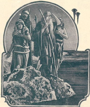
LES DIX COMMANDEMENTS passe au Cinéma du Bourg à Lausanne.

Vous passerez d'agréables soirées à la Maison du Peuple (de Lausanne).