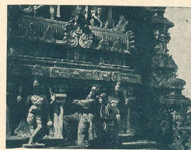
Quelques scènes du film passionnant Le Raid en Avion autour du Monde en location chez Pandora Film à Berne.