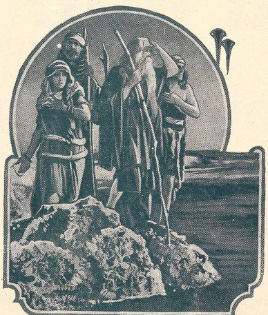
LES DIX COMMANDEMENTS passe au Cinéma du Bourg à Lausanne.

Vous passerez d'agréables soirées à la Maison du Peuple (de Lausanne).