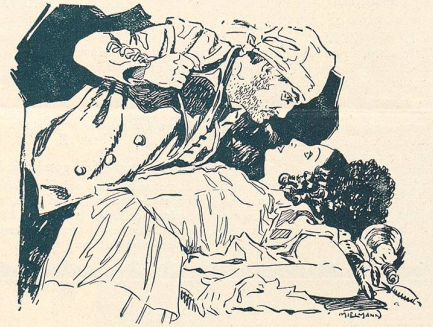
„Amours de Contrebandiers“ qui passe cette semaine au Théâtre Lumen.