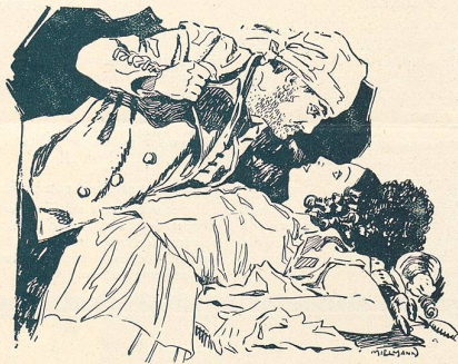
„Amours de Contrebandiers“ qui passe cette semaine au Théâtre Lumen.