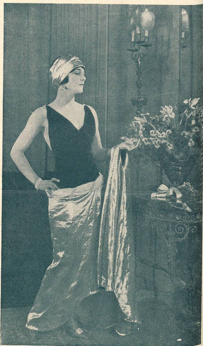
LEATRICE JOY dans LE RÉQUISITOIRE