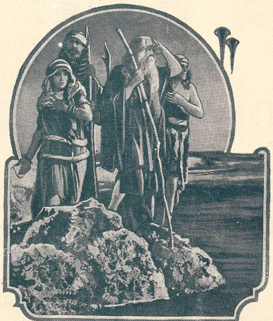
LES DIX COMMANDEMENTS passe au Cinéma du Bourg à Lausanne.

Vous passerez d'agréables soirées à la Maison du Peuple (de Lausanne).