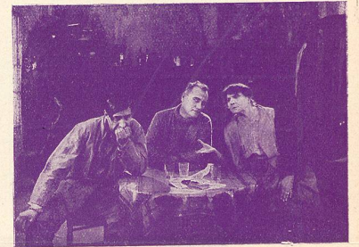
Les Deux Gosses