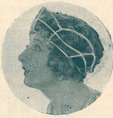
BETTY BLYTHE dans „Pour un Collier de Perles“.

Vous n'en saurez pas davantage pour aujourd'hui, vous ne saurez qu'en voyant le film s'il se termine en gaieté ou en tristesse. (Mon Ciné.)