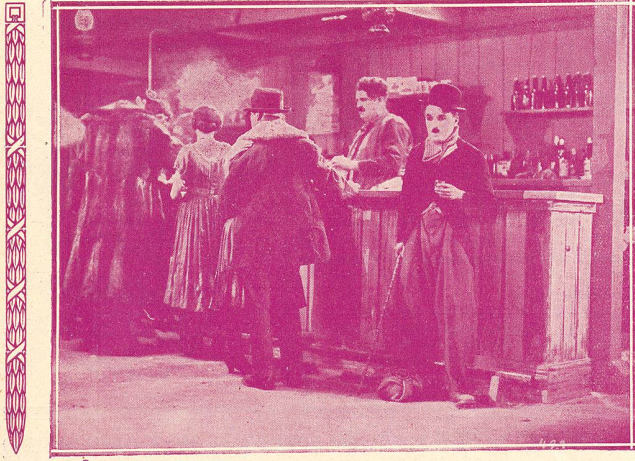
Une des principales scènes de LA FIÈVRE DE L'OR avec Charlie Chaplin.