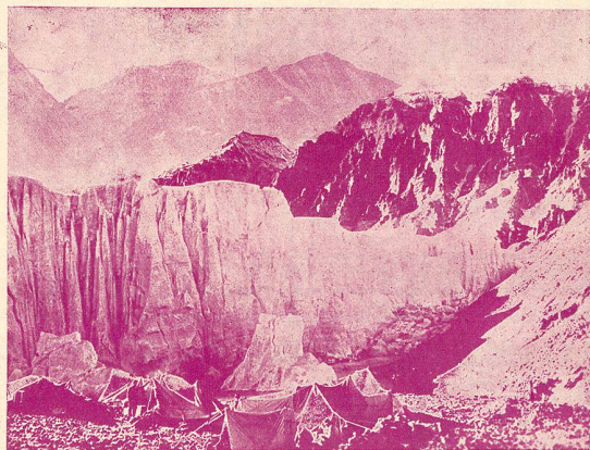
L'installation des dépôts sur le glacier Rongbuk (L'Inaccessible).